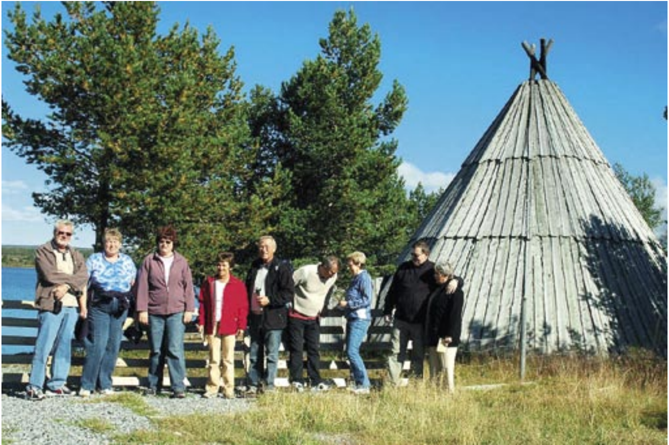
En pust i bakken foran lavvoen på Golsfjellet.