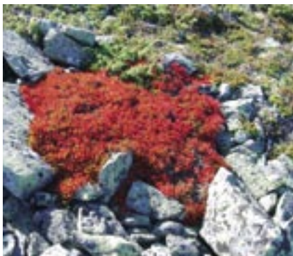
Høstfjellet gir mange fine fargeopplevelser i september.

Tradisjonen tro har A.L.F. Buskerud avholdt høstseminar, denne gangen var vi igjen på Oset Høyfjellshotell, som ligger på Golsfjellet. Også denne gang var vi heldige med været, og hva er vel mer oppbyggende enn sol og vakre høstfarger.